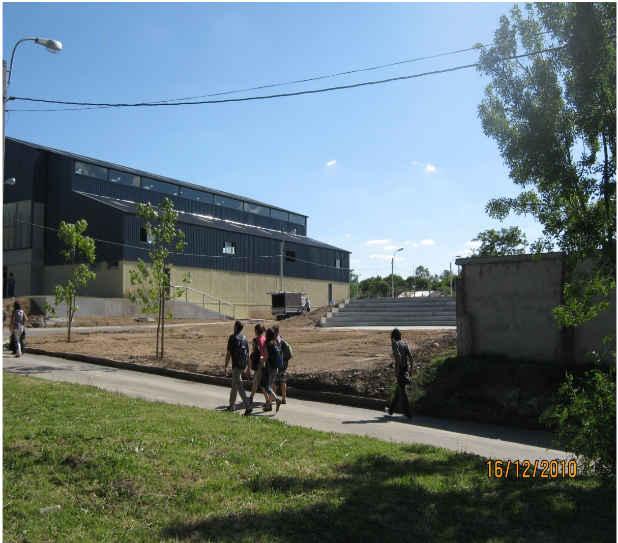
Asentamiento “Barrios Unidos” - Departamento de Montevideo